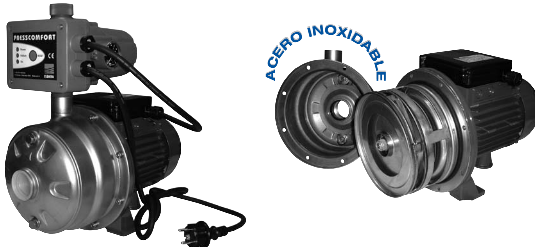
TABLA DE SELECCIÓN RÁPIDA (GRUPOS DE PRESIÓN 2CDX)